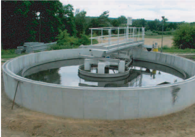
Modernizacja i rozbudowa oczyszczalni ścieków w Mieszkowicach. Modernization and extension of a wastewater treatment plant in Mieszkowice.