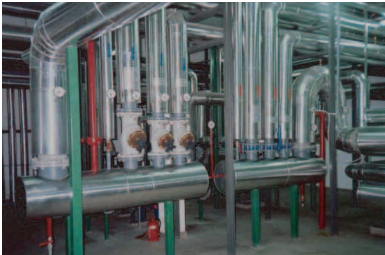
Modernizacja systemu ciepłowniczego Samodzielnego Publicznego Szpitala Zespołowego w Szczecinie przy ul. Arkońskiej. Modernization of the heating system of the Public Hospital in Szczecin, ul. Arkonska.

W roku 2003 Wojewódzki Fundusz przekazał inwestorom realizującym zadania służące ochronie środowiska kwotę 70 448 tys. zł. W ramach tej pomocy 50 376 tys. zł stanowiły pożyczki, natomiast 20 072 tys. zł – dotacje.